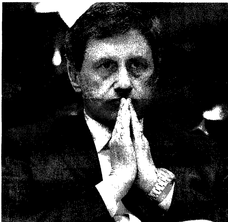
Sindaco di Roma Gianni Alemanno