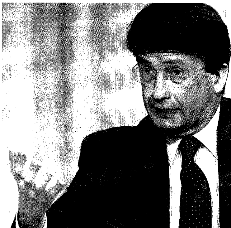
Segretario del Pd Dario Franceschini